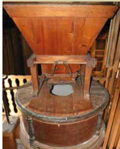
Notranjost mlina na veter