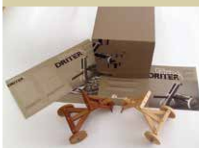
Driter, otroški tricikel iz rudniških kolonij