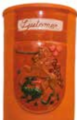
Samorog v ljutomerskem grbu - hladilna posoda za vino Saše Žuman