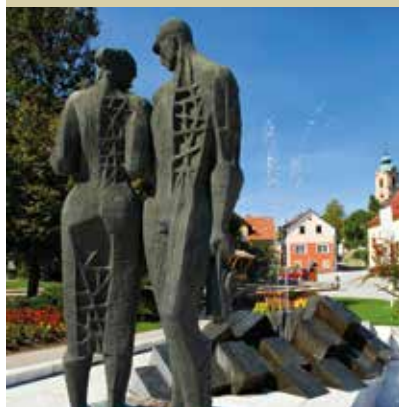
Spomenik rudarjem v Mežici

Več informacij: www.podzemljepece.com www.mezica.si