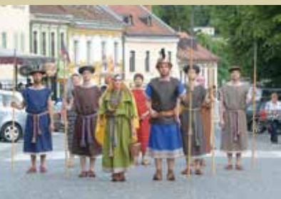
Praznik situl v Novem mestu

Območje današnjega Novega mesta je bilo poseljeno že pred dva tisoč leti, o čemer pričajo arheološke izkopanine. Za ustanovitev mesta štejeemo 7. april 1365, ko je Rudolf IV. Habsburški podelil posebne pravice in postave mestne naselbine. Ena glavnih mestnih pravic, ki jih je mesto prejelo, je bila pravica do trgovanja.