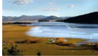
Jezero, ki vedno znova očara in preseneti

Ko je graščak opazil skrivno druženje mladih, je neke noči naročil hlapcu, naj prestavi luč nad jamo Karlovice. Tisto noč je Šteberčan veslal proti lučki, ki je stala pred nevarno odprtino. Ko je priveslal v bližino, mu več ni bilo pomoči in pogoltnila ga je deroča voda. Ko je lepa Karlovčanka izvedela za usodo najdražjega, je sama skočila čez grajsko obzidje v jezero in utonila. Nesrečnih zaljublencev ni več, ostajata pa ljubezen in Cerkniško jezero.