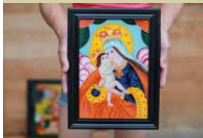
Slike na steklu Irene Jurjevič