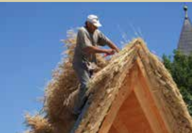
Prekrivanje slovanskih zemljank

Biosferno območje ob reki Muri je dobilo potrditev z vpisom na UNESCOV seznam območij posebnega pomena. Pestra narava v murskih lokah ponuja številne posebnosti. Ena teh je modro obarvana žaba, ki jo v deželi ob Muri najdemo le nekaj dni v letu. Samci se v času parjenja izrjave obarvajo modro in s tem privabijo samice k parjenju. Barvit obred spremlja glasno regljanje. Če ga želimo ohraniti, naj ostane našim očem skrito. Domišljiji in radovednosti lahko damo krila z upodabljanjem te naravne posebnosti v rokodelskih izdelkih.