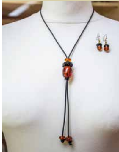
Želod starega hrasta - nakit, Bionera s.p. Natalija Kukec

Danes se obiskovalci Apaške doline radi utaborijo blizu očeta panonskih hrastov in taborjenje popestrijo s kolezarjenjem vzdolž slikovite reke Mure. Za gramoznice, kjer so odkrili dragocenega očaka, skrbijo ribiči. Ureja jo jih in negujejo kulturno krajino, ki zlagoma prehaja v loko proti Muri. Skupaj z ostalimi domačini še upajo na oživitev enajstmlinskega kanala. Simbolna vež današnjih dni in burnega zgodovinskega obdobja iz časa rasti očeta panonskih hrastov je zapisana v izvornem nakitu, stalnici vseh kultur in civilizacij.