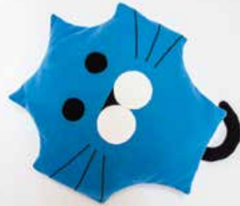
Mačje mesto - vzglavnik, VDC Gornja Radgona

Malo krajev na svetu se lahko pohvali z naravnimi vrelci slatine. V občini Radenci pravijo tem vrelcem »buble«, saj z izvirsko mineralno vodo kar naprej spuščajo mehurčke in se ob tem brbotanju oglašajo – bublajo, kot rečejo domačini. O bublah je več legend. Prva pravi, da bublajo škrtati, ki s kopanjem podzemnih rogov utirajo pot zdravilni vodi. Druga pravi, da bublajo coprnice, ki v kotlu pod vrelci kuhajo cmoke. Tretja pravi, da vrelci bublajo, ker zbirajo grom in točo. Vsakdo naj izbere tisto, v katero bo verjel, o bubljanju pa se lahko prepričate tako, da prislonite uho na zemljo tik ob vrelcu in pozorno prisluhnete.