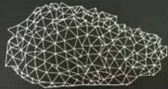
Meteorit, klekljana čipka Lucije Petrušič, avtorica vzorca Mira Časar