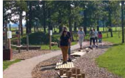
Park doživetij Križevci