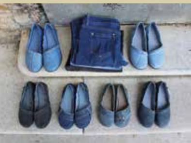
Maja Modrijan, balerinke iz starih hlač