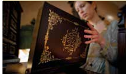
Janez Vajkard Valvasor je izkazal zanimanje za zelišča že v Slavi vojvodine Kranjske.