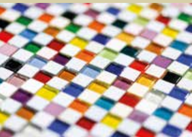
Srečko Likar, mikro mozaik