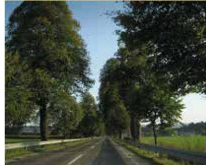
Napoleonov drevored v Logatcu

Kose obrušenega in zglajenega lesa podobnih oblik so včasih, ko še ni bilo sodobnih materialov, matere dajale dojenčkom, ko so jim rasli zobki, da so si z njimi drgnili boleče dlesni.