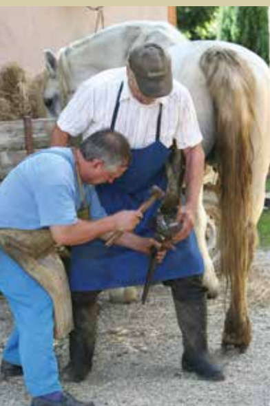
Kovač v Razkrižju

Ivanov izviri - stekleni podstavek, VDC Gornja Radgona