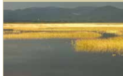
Cerkniško jezero, ko ga napolni voda