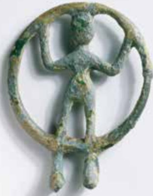
Orant ali molivec iz prvega stoletja p.n.št.

Orant ali molivec je najbolj znamenita najdba s pobočja Vinjega Vrha, ki upodablja človeško postavo z visoko dvignjenima rokama v drži molivca. Postava bronaste ga obeska je omejena s krogom, ki ga noge v spodnjem delu prestopijo. Sodi v pozno keltsko obdobje (1. stoletje pp. n.št.) in je edinstven v slovenskem mlajšem železnodobnem obdobju. Razlag motiva je več: prisposodba rojstva ali pa prestop magičnega risa, morda celo prestop nebesnega svoda v veselje. Lahko pa simbolizira onostranstvo, ki je človekovo upanje in zmaga nad smrtjo, kar črpamo iz bogatih mitoloških in religioznih predstav Keltov iz obdobja, ko je obesek nastal. Lahko ga primerjamo tudi z Da Vincijevo upodobitvijo Vitruvijevega človeka, ki z omejitvijo postave znotraj kroga ponazarja skladnost človekove figure, orant pa to popolnost ruši. Orant je postal prepoznaven znak občine Šmarješke Toplice, saj je osrednji lik celostne podobe Hiše žive dediščine, medgeneracijskega interpretacijskega centra dediščine. Njena vsebina nudi vpogled v življenje lokalnih prebivalcev skozi različne zorne kote in zgodovinska obdobja ter na inovativen način predstavi bogato kulturno dediščino območja Šmarjeških Toplic.