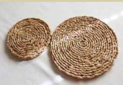
Izdelki iz ličkanja Rozine Kum

Občino Straža povezuje reka Krka – na eni strani brega se dviga Straški hrib, bogato poraščen z bukovjem, ki ga prepleta srobot. Od tod ime vrha – Srobotnik. Po spodnjem delu Straškega hriba se razprostirajo vinogradi s številnimi malimi zidanicami. Tamkajšnji prebivalci so nekoč hodili v strmino na stražo, verjetni čuvati grozdje pred živalmi. Iz tega običaja je prišlo do imena Straža.