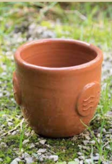
Čaša – topli potok Patricije Žnidar