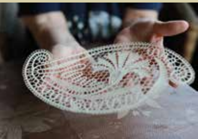
Čipka Mojce Peček