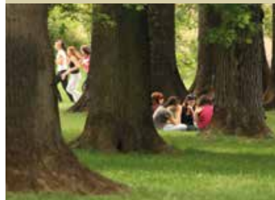
Mladost med stoletnimi hrasti