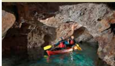
S kajakom skozi turistični rudnik v Mežici