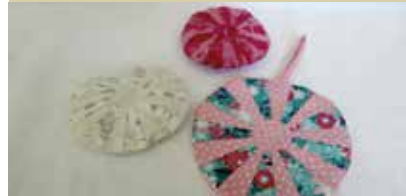
Dišeče tekstilne brošče in okrasne gumbke za dom, odličavljene z izbranimi zelišči, je izdelala Karmen Rozman iz Litije.