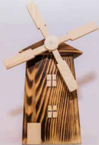
Mlin na veter - šparovček iz lesa, Valerija Cer

Iz šibe spleteni koši in košare danes niso pogosto v rabi, vsaj ne toliko kot takrat, ko se je mlin na veter vrtel ob vsakem vetrovnem dnevu. O iznajdljivosti prednikov, ki so vsa dela zmogli sami, pričajo orodja in delovni pripomočki, razstavljeni v stari šoli na Stari gori. Večina orodij je iz okoliškega lesa, zato ne preseneča, da se tukajšnji rokodelci spominjajo varčnosti prednikov z domiselnimi lesenimi hranilniki v obliki mlina na veter.