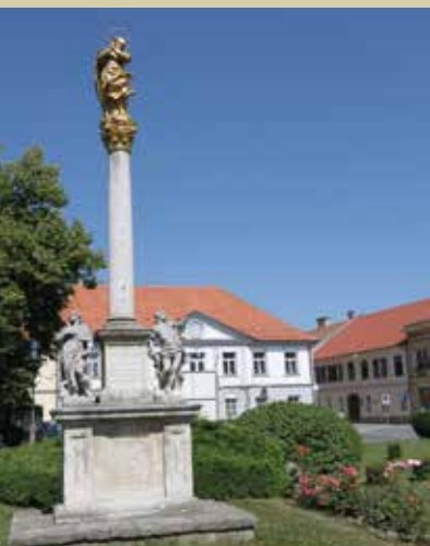
Kužno znamenje v Ljutomeru