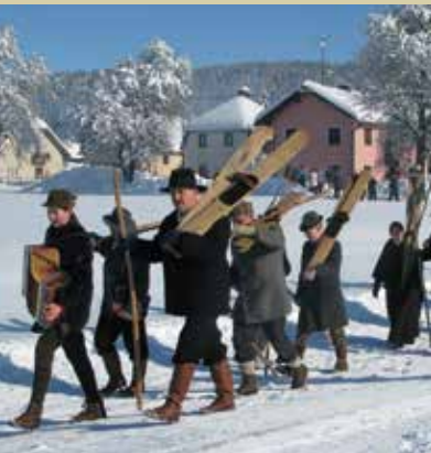
Prireditev Smučanje po starem na Blokah