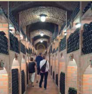
Klet Radgonskih goric