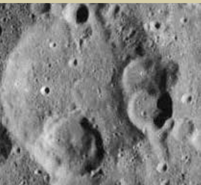
Krater Vega na Luni, poimenovan po Juriju Vegi