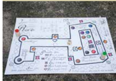
Igra o zaroti na gradu Rače, ki so jo izdelali v CDUO Slovenska Bistrica