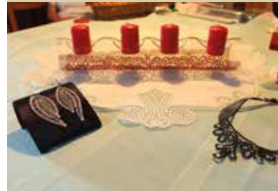
Klekljane čipke članic TŠD Kostel