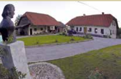
Rojstna hiša barona Jurija Vege v Zagorici, Dol pri Ljubljani