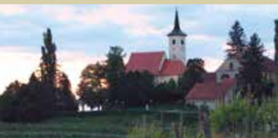
Jeruzalem med vinogradi

Ljutomer je neizbrisljivo povezan s konji. Znan je kot zibelka reje avtohtone pasme kasaških konj. Ljutomerski kasači krasijo Ljutomer in Prlekijo tudi v simbolnem smislu. V ljutomerskem grbu je v ospredju podoba konja – samoroga, ki se vzpenja nad pretečim zmajem. Spomin na mitološka bitja odpira globlji vpogled v naravo tukajšnjega človeka, ki živi v kraju s skoraj tisočletno tradicijo mestnega trga, a je ohranil pristani stik z naravo. Samorog simbolizira neukrotljivo moč narave in lepote, ki nas hkrati straši in ponuja čudodelno zdravilo. Le nežni devici je dano ukrotiti samoroga, ki nas spominja na nezavedni del naše biti in pooseblja transcendenco, prenekaterikrat doživeto prav v nemirni Prlekiji. Eruptivna moč samoroga nam pomaga razumeti naravo tukajšnje biti, njeno lepoto in deviškost, ki jo razkriva tudi prleški dialekt.