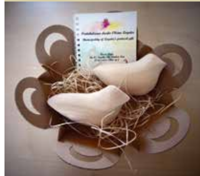
Protokolarno darilo Občine Logatec, ki ga prejmejo občinski nagrajenci