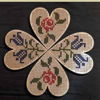
Leseno srce z izvezenimi cvetličnimi motivi