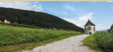
Pogled na Hudičev turn v Soteski