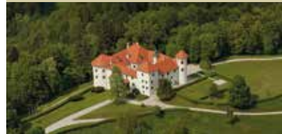
Sloviti grad Bogenšperk, ki se dviguje nad Šmartnem pri Litiji.

Sam Valvasor pa tudi vsebine iz vsakdanjega življenja ljudi, ki jih je Valvasor raziskoval in o njih pisal, so danes v navdih lokalnim ustvarjalcem.