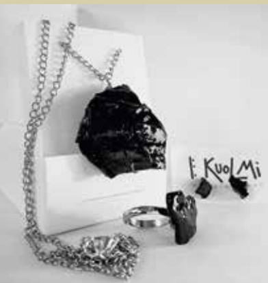
Nakit iz premoga

Zgodovina Zasavja je zadnji dve stoletji povezana s premogom, ki je oblikoval vse tri zasavske občine: Hrastnik, Trbovlje in Zagorje ob Savi. Premog je bil spodbujevalec razvoja mest, industrije, priseljevanja ljudi, boja za lepše življenje, a je tudi kriv za onesnaženo okolje.