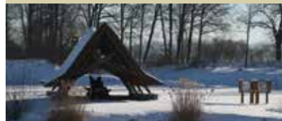
Oče panonskih hrastov