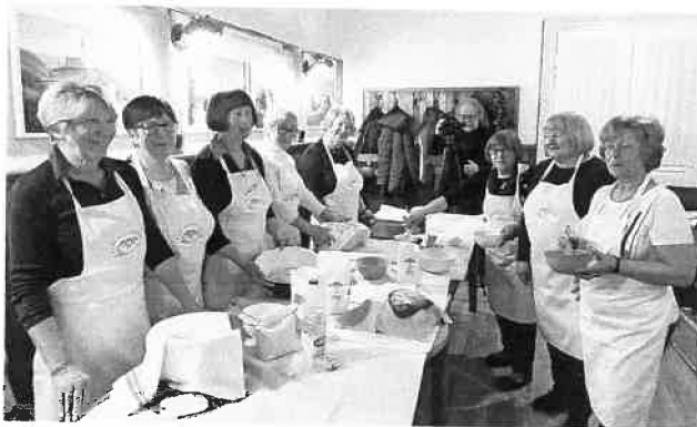
Članice Univerze za tretje življenjsko obdobje Ilirska Bistrica so pripravile nov študijski program K(r)uharije, v okviru katerega so raziskale lokalne običaje in navade, povezane s pripravo in uporabo kruha.