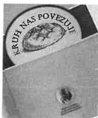
V knjigi Kruh nas povezuje so zbrani recepti in običaji, povezani s kruhom in žitom.